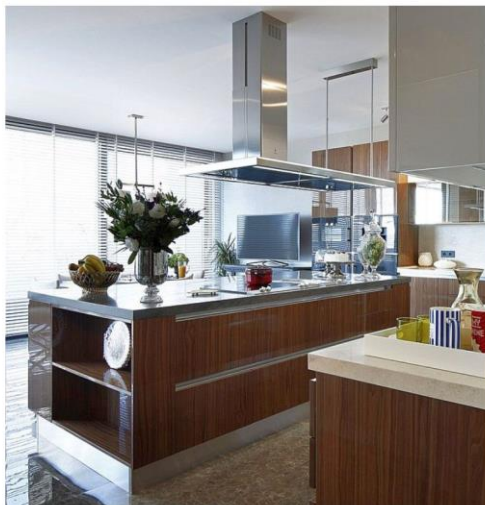
Cocinas Mia y Volare

28.07.2018 El proyecto, ideado por un equipo de arquitectos locales, consiste en la realización de dos edificios con áreas verdes; cada piso tiene dos apartamentos con una superficie muy amplia, dotados de servicios exclusivos y jardines aéreos, además de áreas recreativas y deportivas, piscinas cubiertas, carriles y rutas para bicicletas para admirar la vista de todo el complejo del edificio, en el que Aran ha